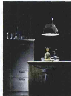
La cucina con Scavolini

meglio il nostro mestiere. A un certo punto avevo le fabbriche sparse in tutto il paese, non vedevo più la mia gente. Vedevo solo chi era nel piccolo building con me... Qui è fantastico, vai al bar, al ristorante, riconosci le facce che incontri.