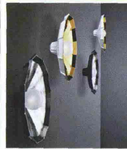
Mysterio con Foscarini