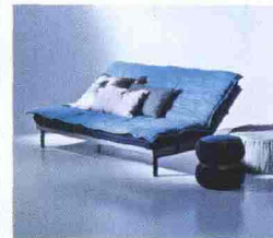
Tiramigiù Sofa Bed con Moroso