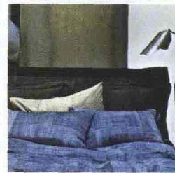
Pure Denim con Zucchi